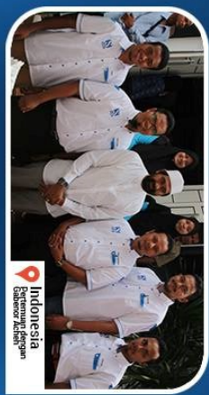
Indonesia Bantuan Adhika